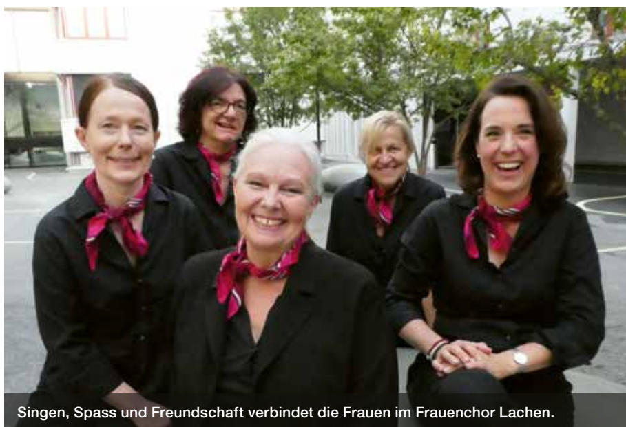
Singen, Spass und Freundschaft verbindet die Frauen im Frauenchor Lachen.

Ich nehme an einer Probe teil: Es wird gedehnt, gestreckt, bewusst ein- und ausgeatmet, der Körper wird abgeklopft, um den Arbeitstag abzuschütteln, der Kiefer wird gelockert und spätestens beim dreistimmigen Parapapa bin ich voll Begeisterung dabei und fange an, mich im Rhythmus zu bewegen. Es macht Spass dabei zu sein, ich fühle mich im Hier und Jetzt und die Konzentration liegt voll und ganz auf den Notenblättern. Nach dem fünfminütigen Aufwärmen wird Super Trouper von Abba angestimmt. Das kunterbunte Liederrepertoire besteht aus englischen,