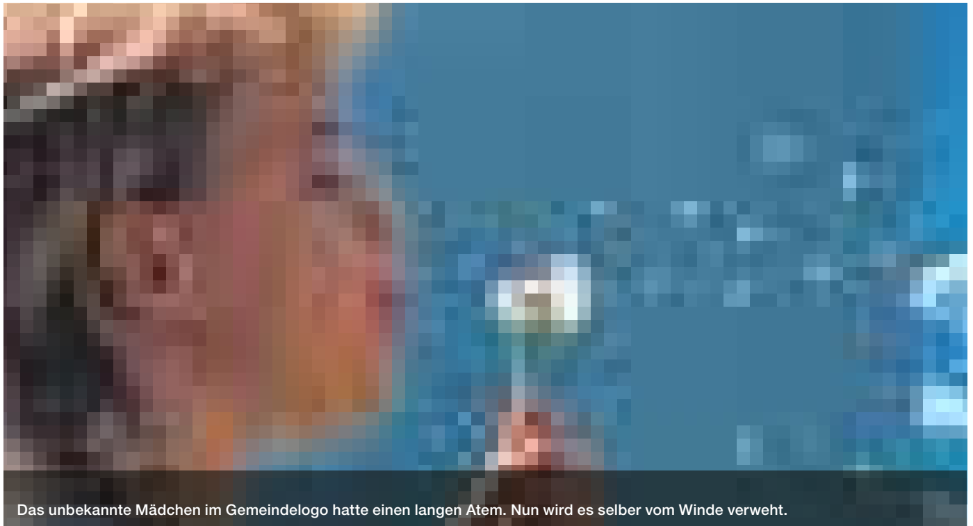
Das unbekannte Mädchen im Gemeindelogo hatte einen langen Atem. Nun wird es selber vom Winde verweht.

TEXT: JÜRIG WATTENHOFER