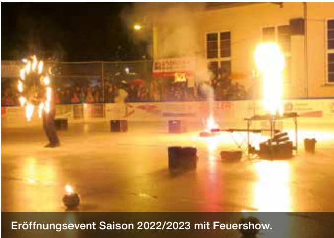
Eröffnungsevent Saison 2022/2023 mit Feuershow.

Ab Mittwoch, 8. November 2023, heisst das mittlerweile legendäre Lachner Eisfeld mit seinem ebenso beliebten «lisstübli» seine Gäste bereits zum 17. Mal herzlich willkommen. Erneut hat es das emsige Team mit dem Organisationsgenie Cornelia Köpflí geschafft, ein äusserst attraktives Programm zusammenzustellen. TEXT: DANI KÜHNE