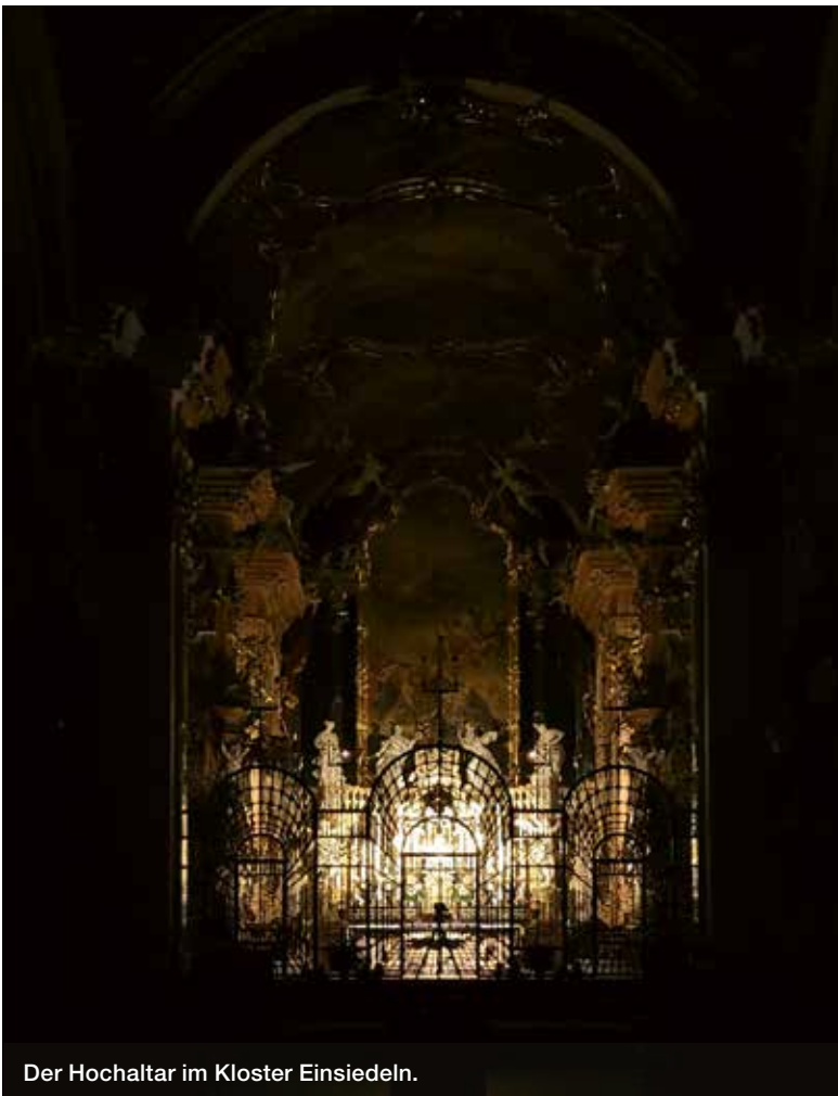
Der Hochaltar im Kloster Einsiedeln.

Abwart in der katholischen Kirchgemeinde in Zürich-Höngg. Dort arbeitete ich vier Jahre – das war super. Die Menschen dieser Kirchgemeinde haben einen sehr guten Zusammenhalt, wohl weil sie eine