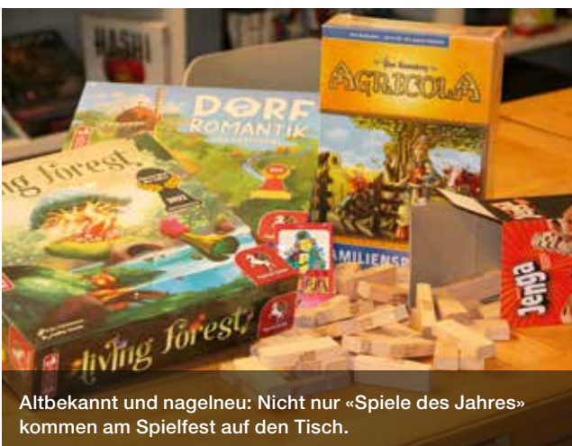
Altbekannt und nagelneu: Nicht nur «Spiele des Jahres» kommen am Spielfest auf den Tisch.

Die ausgestellten Spiele werden am Sonntagnachmittag ab 15 Uhr zu günstigen Preisen verkauft. Wenn das Wetter es erlaubt, lädt das Jugendbüro March rund um den Bären an beiden Tagen zu alten und neuen Gassenspielen ein.