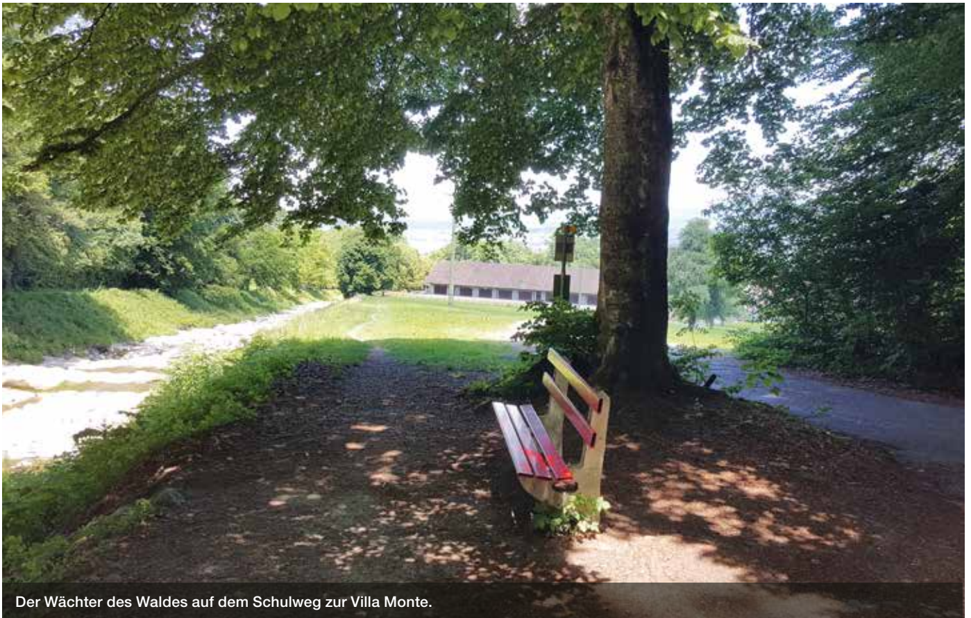
Der Wächter des Waldes auf dem Schulweg zur Villa Monte.

periodisch Hochwasser, weshalb sich auch eine Wuhrkorporation seit Jahrzehnten um den Bach kümmert. Der Lokalname Steinegg zeugt von den wiederholten «steinreichen» Ablagerungen des Bachs. Mit der Umsetzung des Hochwasserschutzprojekts wird die Sicherheit des Siedlungsgebiets von Lachen und Umgebung verbessert.