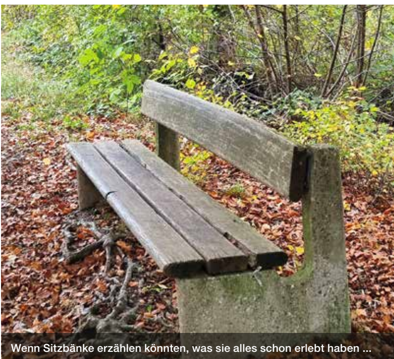
Wenn Sitzbänke erzählen könnten, was sie alles schon erlebt haben ...

Das überbaute Gebiet blieb haarscharf von Überschwemmung verschont. Der Spreitenbach führt