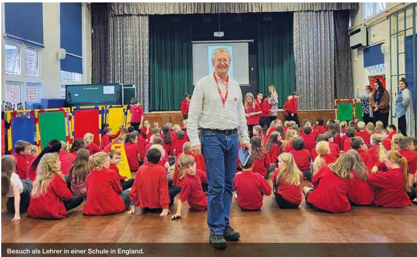
Besuch als Lehrer in einer Schule in England.

viel Gestaltungsmöglichkeit, meine Arbeit so zu machen, wie ich es für richtig halte, trotz aller Bürokratie.