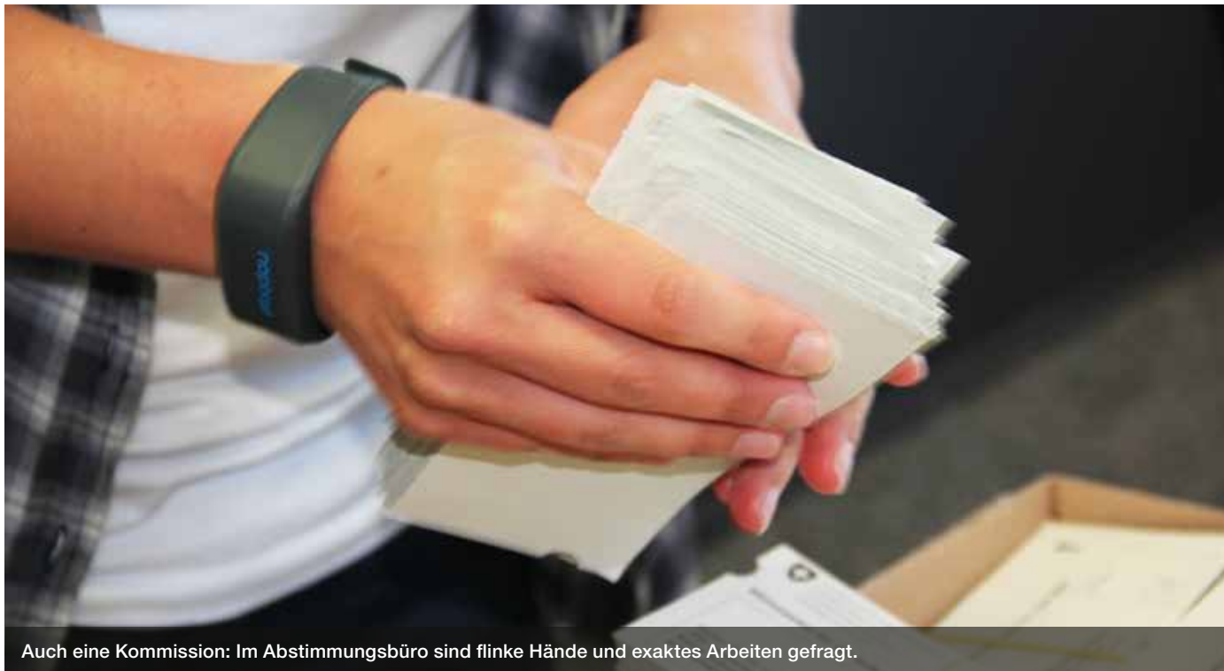
Auch eine Kommission: Im Abstimmungsbüro sind flinke Hände und exaktes Arbeiten gefragt.

Für den Gemeinderat sind sie ein unverzichtbares Führungsmittel, für Bürgerinnen und Bürger eine Plattform, um in der Gemeinde entscheidend mitzuwirken: In Kommissionen sind Fachwissen, Engagement und Tatkraft gefragt. | TEXT/BILD: JÜRG WATTENHOFER