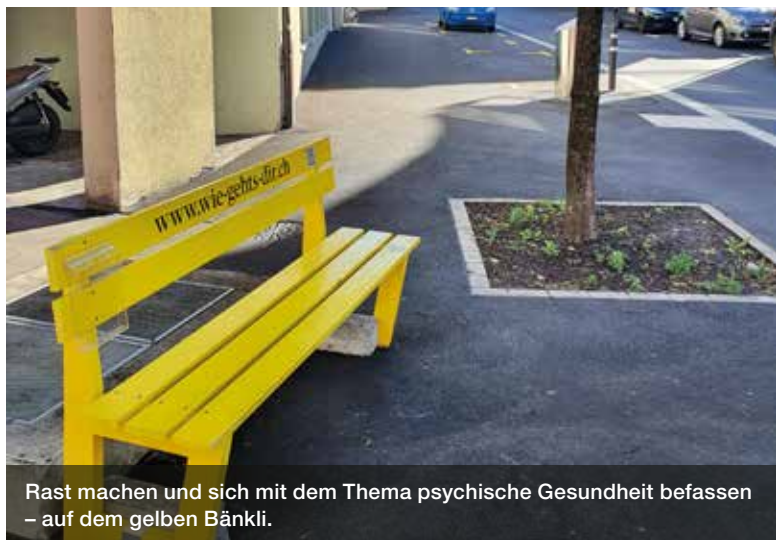
Rast machen und sich mit dem Thema psychische Gesundheit befassen – auf dem gelben Bänkli.

«Wie geht's dir?», fragt uns seit dem Frühjahr 2023 ein knallgelbes Bänkli im Gangynerweg. Es lohnt sich, bei einer kleinen Ruhepause auf der Bank innezuhalten und dieser durchaus ernst gemeinten Frage nachzugehen. | TEXT/BILD: HEIKE KUHN