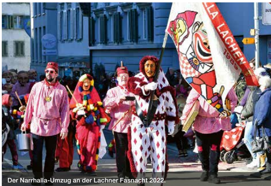
Der Narrhalla-Umzug an der Lachner Fasnacht 2022.

Am Samstagvormittag werden die Fasnächtler das Obersee-Center stürmen: Röllis, Dominos, Foslis, Lachner Grinde, Hexen aller Art und viele andere Fasnachtsfiguren mischen sich unter die Leute im Einkaufszentrum, und Guggenmusiken liefern ihren launigen Sound dazu. Am Nachmittag geht das Märchler Narrensymposium im Festzelt auf dem Seeplatz über die Bühne, und am Abend führt der erste Umzug mit 45 Gruppen und etwa 1'300 Mitwirkenden durch das Dorfzentrum. «An diesem Samstag wird Lachen im Ausnahmezustand sein», sagt Narrenvater Benz.