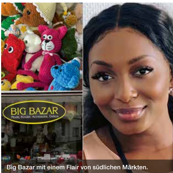
Big Bazar mit einem Flair von südlichen Märkten.

Beim Betreten des Big Bazar fühlt man sich in die lebhaften Märkte südlicher Länder versetzt, wo jeder Schatzsucher nach dem perfekten, unkonventionellen Geschenk fündig wird.